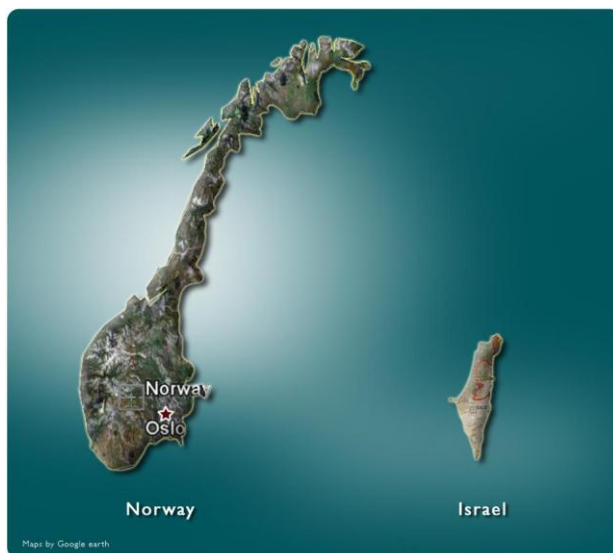
Det lille fantastiske landet i nord og det bittelille, men fantastiske landet i Midt-Østen.