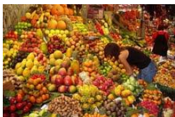
Bilde: Mahane Yehudas fruktmarked

Lørdag 05/10: Frokost. Fridag. Det er sabbat. De som ønsker det kan gå i synagogen like ved hotellet. Gamlebyen er åpen. Turlleder er gjerne med for guiding og shopping. Det jødiske kvarter og Vestmuren. Om kvelden: Ben Yehuda street