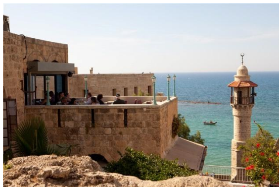
Bilde: Jaffa med utsikt over Middelhavet

Utallige «Pilegrimsreiser» er gjennom tidene arrangert til «det hellige land» og utallige er alle de som har reist hjem med gode minner og opplevelser etter besøk til de historiske og hellige stedene vi kjenner fra bibelhistorien. Israel er et mangfoldig og spennende land. Et av verdens minste land, med hele verdens oppmerksomhet rettet mot seg. En smeltedigel av nytt og gammelt. Bibelsk landskap og hyrder på marken, side om side med den mest moderne høyteknologi. Kulturer som møtes og lever side ved side. Politisk et brennpunkt. Historien er mangslungen og dramatisk. Et jødisk land, men med alle religioner representert med deres mange avskygninger og varianter.