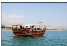
Bilde: Båttur på Gennesaret sjø

Onsdag 02/10: Frokost. Dagens stikkord: Tabgha. Båttur på Gennesaretssjøen til kibbutz Ein Gev. Golan. Katzrin. Amiam kunstnerlandsby. Golan Winery. Om kvelden spiser vi middag i Zefat (Safed).