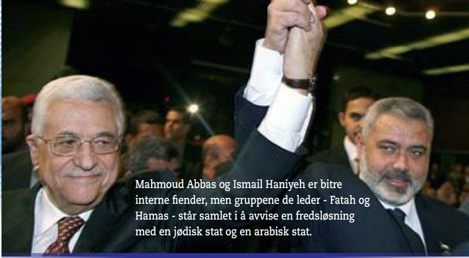
Mahmoud Abbas og Ismail Haniyeh er bitre interne fiender, men gruppene de leder - Fatah og Hamas - står samlet i å avvise en fredsløsning med en jødisk stat og en arabisk stat.